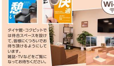
タイヤ館・コクピットでは待合スペースを設けて、皆様にくつろいでお待ち頂けるようになっています。雑誌・TVなどをご覧になってお待ちください。