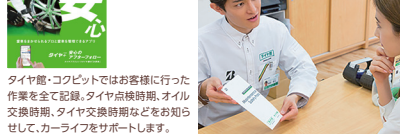
タイヤ館・コクピットではお客様に行った作業を全て記録。タイヤ点検時期、オイル交換時期、タイヤ交換時期などをお知らせして、カーライフをサポートします。