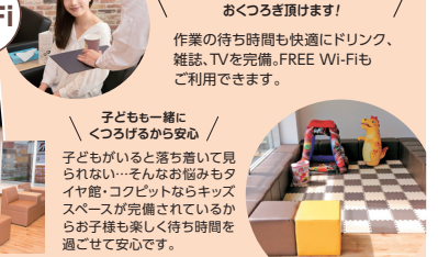
待合時間は無料ドリンクサービスにて、お過ごし頂けます! 作業の待ち時間も快適にドリンク、雑誌、TVを完備。FREE Wi-Fiもご利用できます。子どもと一緒にくつろげるから安心! 子どもがいると落ち着いて見られない!...そんなお悩みもタイヤ館・コクピットならキッズスペースが完備されているからお子様も楽しく待ち時間を過ごして安心です。