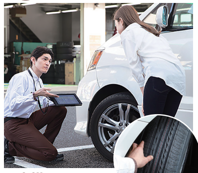
お客様のタイヤを一緒に確認致します。